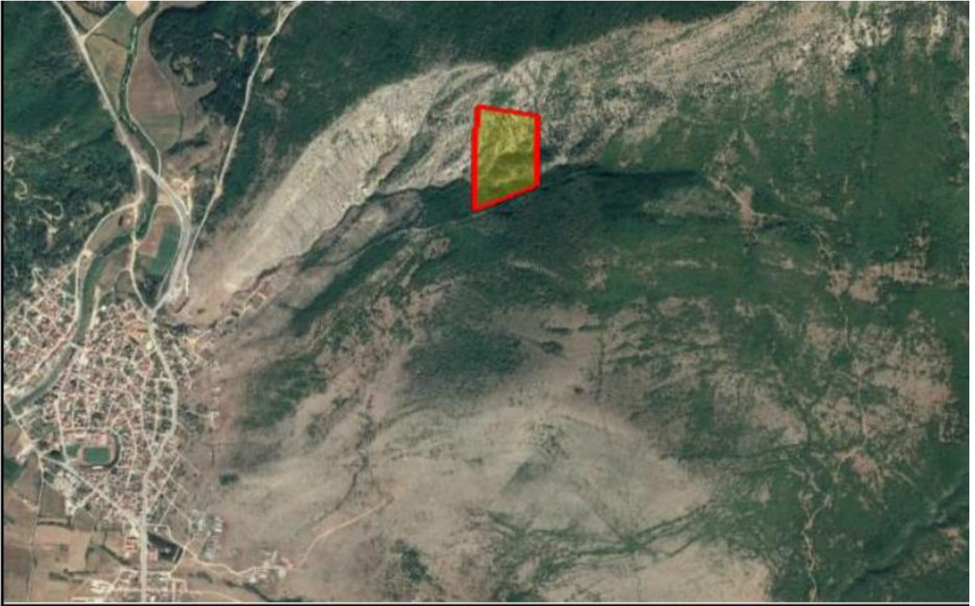
Απόσπασμα Google Earth.